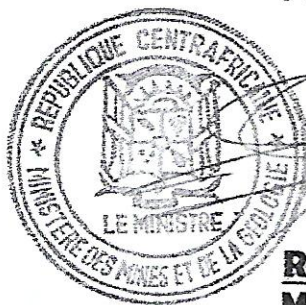
Rufin BENAM-BELTOUNGOU Ministre des Mines et de la Géologie